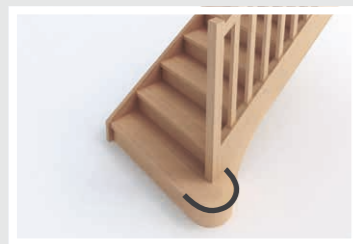
Marche royale D3-1