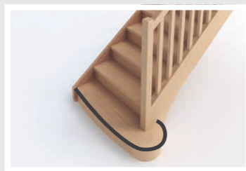
Marche royale cintrée D4-1