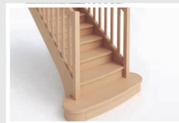
Marches royales cintrées D5-2