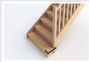
Marche simple D1-1

Nous vous présentons donc dans les pages suivantes toutes nos solutions pour concevoir votre escalier : du lexique aux éléments de finition, sans oublier les essences de bois et les couleurs.