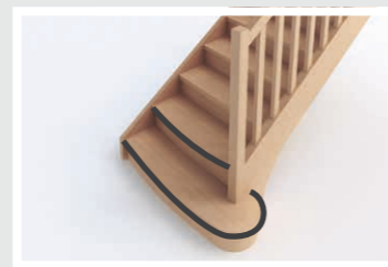
Marches royales cintrées D5-1